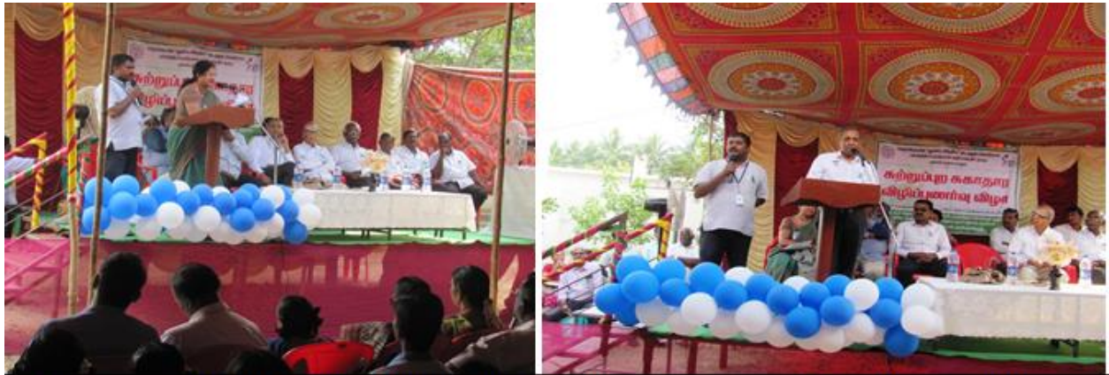
Awareness Mela 2016: A small initiative towards creating open defecation free villages